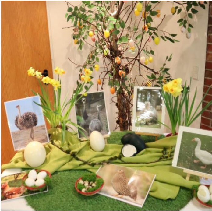
Unsere Hasen im Außengehege, die bequem von drinnen beobachtet werden konnten, eroberten viele Herzen.

Natürlich durfte auch eine Schokoladen-Osterhasen-Ausstellung nicht fehlen.